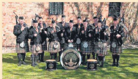
Green Forest Pipe Band spiller op til en festlig gudstjeneste