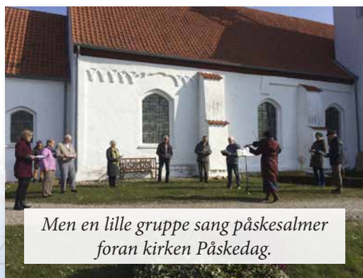
Men en lille gruppe sang påskesalmer foran kirken Påskedag.