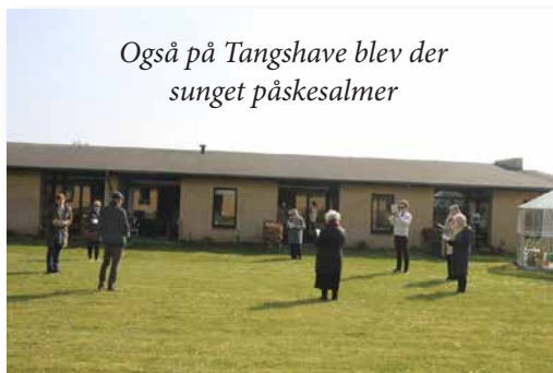
Også på Tangshave blev der sunget påskesalmer