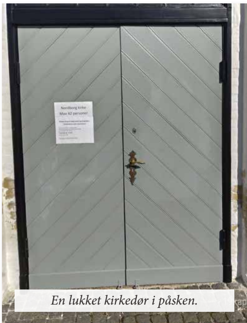
En lukket kirkedør i påsken.