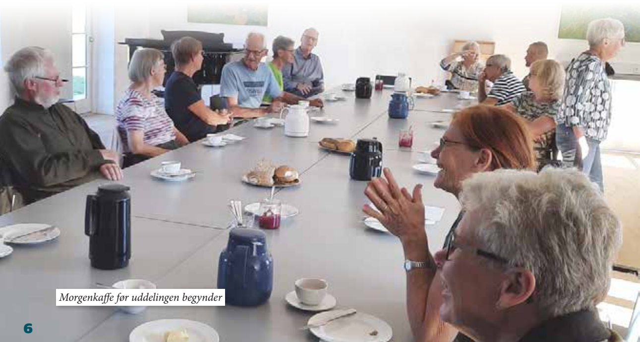
Morgenkaffe før uddelingen begynder