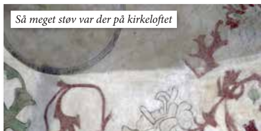
Så meget støv var der på kirkeloftet

Da jeg ikke tror, der er så mange, der kender til den slags arbejdsopgaver, inviterer vi til »åben platform« tirsdag den 24. november kl. 15.00-18.00. Her vil specialisterne fortælle om deres arbejde. Vel mødt – der er kaffe og lidt sødt under »tribunen«.