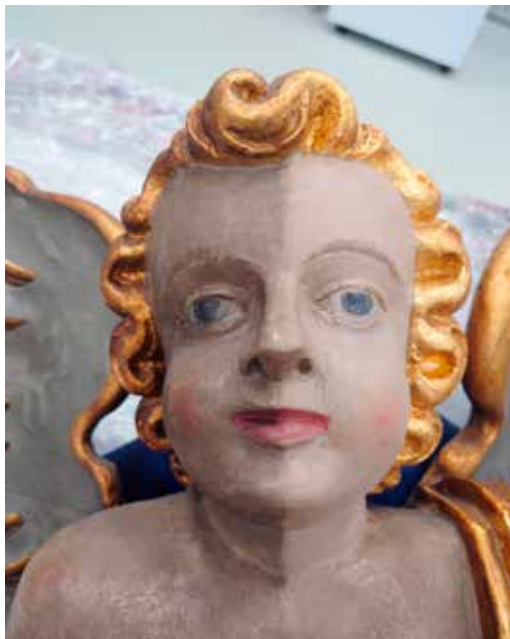
Engel fra altertavlen, hvoraf halvdelen er renset.

den helt store male tur siden, så nu er vi i gang med at finde de økonomiske midler til dette projekt også.