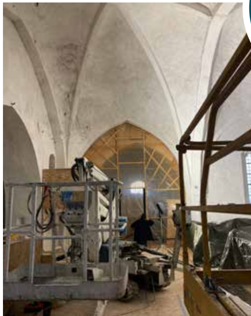
Lift, der kan nå toppen af hvælvingerne.

Går alt efter planen, håber vi at kunne genåbne kirken omkring 1. maj 2024. Indtil da vil vi afholde alle vore gudstjenester i Sognegården.