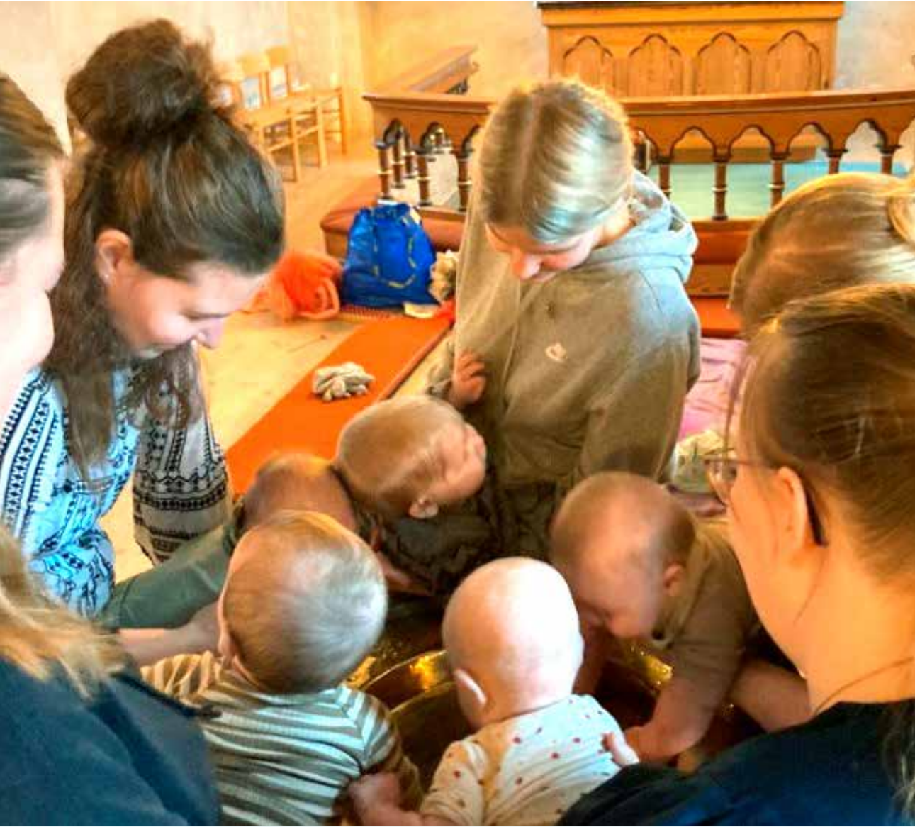
Babysalmesang: Trængsel omkring døbefonten